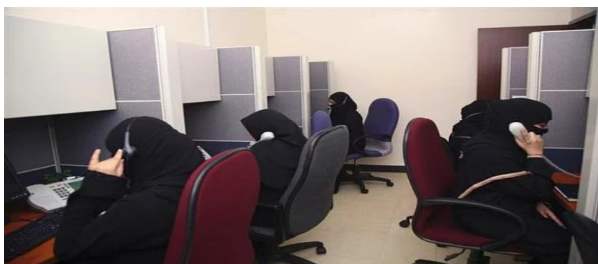
Figura 2: Atendentes em expediente.

o cabelo e o rosto. O rosto deve ser coberto na presença de homens que não sejam o seu guardião (pai ou marido), e não é bem-vinda em reuniões de negócios, dificultando a linguagem não-verbal apontada como importante por Maciel e Valese (2003) na prática da interação e negociação profissional. A profissional também encontraria ruídos na comunicação, tanto para falar ao telefone, como para ouvir o receptor, como mostra a figura 2: