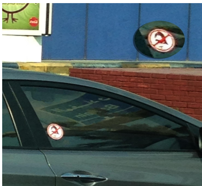
FIGURA 3: Proibição à direção por mulheres