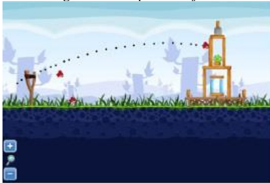
Figura 4: Exemplo de Trajetória