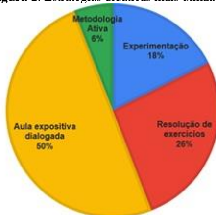
Figura 1: Estratégias didáticas mais utilizadas

Os métodos de ensino tradicional — expositivo e superficial — demonstram que as práticas pedagógicas devem ser revistas. De acordo com Nascimento et al. (2019), 76,6% dos alunos possuem alguma dificuldade na disciplina, e 70,1% consideram que a principal complexidade da matéria está relacionada a aspectos matemáticos. Ademais, somente, 18,2% dos estudantes indicaram preferência pela metodologia mais habitual, ou seja, o uso de quadro, livro e projetor. Por sua vez, Martins (2019) verificou que, entre as estratégias didáticas mais utilizadas, os professores, em 76% das vezes, preferem utilizar a metodologia habitual, ou seja, exposição do conteúdo e resolução de exercícios. Percebe-se que, neste tipo de método, o aluno é mero coadjuvante no processo de aprendizagem, sendo sua função memorizar conhecimentos passados na aula e reproduzi-los nas avaliações para provar que aprendeu o conteúdo, para, após o término do período de avaliação, esquecer o que “aprendeu”.