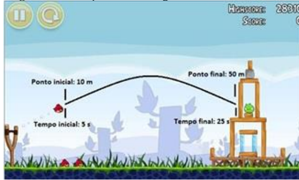
Figura 5: Exemplo de abordagem de Velocidade Média