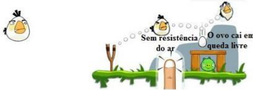
Figura 7: Exemplo de abordagem de Queda Livre