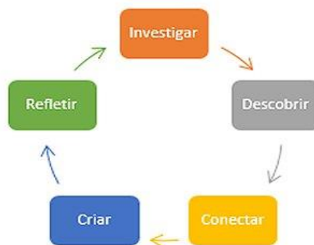
Figura 2: Etapas do modelo STEAM

Este método de ensino provém do modelo STEAM, que, de acordo com Lemes (2020, n.p.), “prevê a integração de conhecimentos de Artes, Ciências, Tecnologia, Engenharia e Matemática, possibilitando ao aluno se preparar para desafios como cidadão e também no mercado de trabalho”. Para tal, o STEAM incentiva o estudo dos alunos por meio de cinco etapas, que são: investigar, descobrir, conectar, criar e refletir.