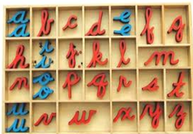
Imagem 3: Alfabeto móvel