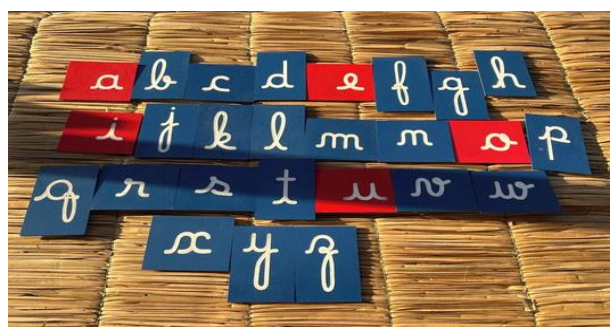
Imagem 2: Letras em lixa