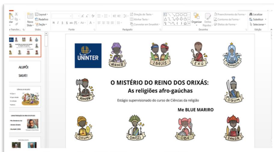
Imagem 1: apresentação da aula e caracterização da área de estudo

As principais festas da religião e análise da paisagem religiosa por meio das fotografias incluídas no Power point. Ao longo da aula foram tiradas as dúvidas e estimulado o debate.