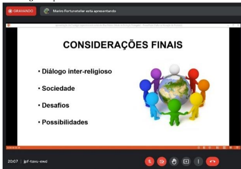
Imagem 3: print do último dia de evento dia 11 de novembro de 2021

No terceiro e último encontro foram apresentados o Mercado público de Porto Alegre, os conceitos de Sagrado e Profano a partir de Eliade (1992) e a realização e correção de uma atividade, em que as pessoas que participaram analisaram imagens e descreveram as paisagens religiosas presentes.