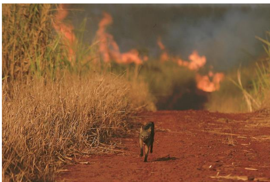
Figura 2: Lobo guará flagrado fugindo de área de produção de cana-de-açúcar submetida a queima no município de Piracicaba/SP.