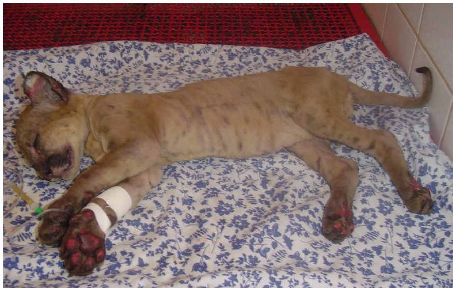
Figura 1: Onça-parda resgatada de queimada no município de Piracicaba/SP.

dizendo que após as queimadas nos canaviais, encontram muitos animais mortos, e os que estão vivos saem feridos, atordoados, abalados com o fogo, a fumaça e o calor intenso.