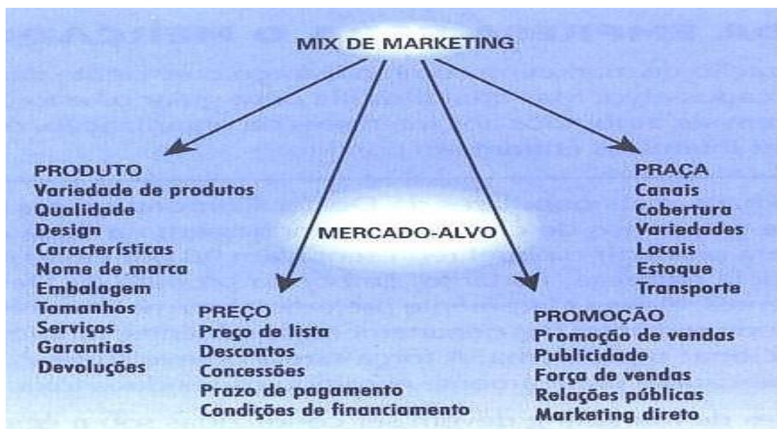
Figura 1 – Os 4 P's de marketing

McCarthy (apud KOTLER, 2000, p. 37) classificou essas ferramentas em quatro amplos grupos, que acabaram sendo popularizadas como os 4ps do marketing: produto, preço, praça (ponto-de-venda ou distribuição) e promoção – originalmente do inglês ( product, price, place, promotion ). As variáveis dos 4Ps são mostradas na figura a seguir: