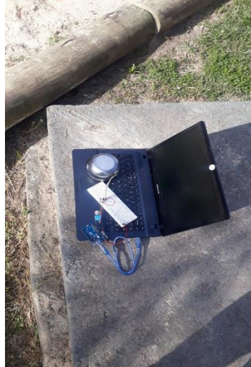
Figura 2: Realização do teste

juntamente com o sistema Arduino e o notebook foram alocados em um espaço onde tinham contato direto com o sol, conforme Fig. 2.