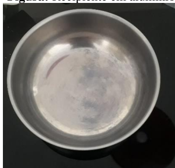
Figura: Recipiente em alumínio

Os testes foram realizados com as mesmas condições térmicas e físicas, sendo utilizado como fonte de calor, o sol; o recipiente utilizado nos três testes é do mesmo material, o alumínio, conforme Fig1.