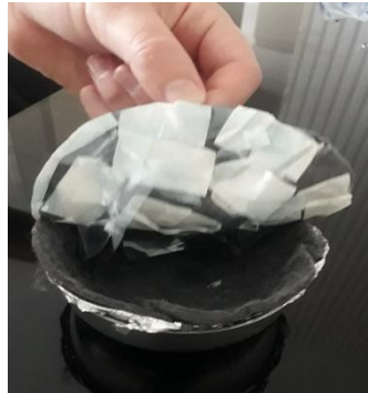
Figura 7: Teste com duas camadas de feltro e PET picotado