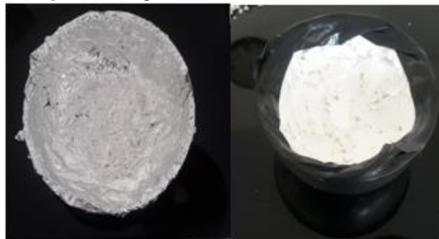
Figura 3: Recipiente revestido com alumínio e EPS

Os dois recipientes foram revestidos primeiramente com uma camada de papel alumínio no seu interior, em seguida foi adicionada uma camada de 2mm de EPS sobre o alumínio, garantindo assim o isolamento térmico. Os recipientes foram sobrepostos, inserido o sensor de temperatura em seu interior e realizada a vedação com fita isolante. Mantiveram-se as condições conforme o 1º teste, com a temperatura externa estável em 23°C.