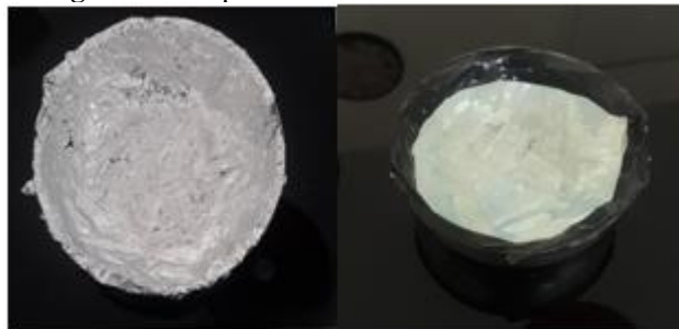
Figura 4: Recipiente revestido com alumínio e PET

Os dois recipientes foram revestidos primeiramente com uma camada de papel alumínio no seu interior, em seguida foi adicionada uma camada de 2mm de PET picotado. Os recipientes foram sobrepostos e o sensor de temperatura inserido em seu interior; realizou-se a vedação com fita isolante e mantiveram-se as condições conforme o 2º teste, com temperatura externa estável em 23°C.